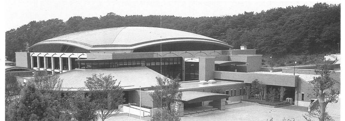
第64回全日本大学対抗大会会場 深谷ビクトール