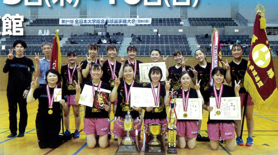
前年女子優勝・神戸松蔭女子学院大学